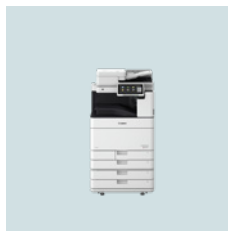
Serie imageRUNNER ADVANCE DX C5700