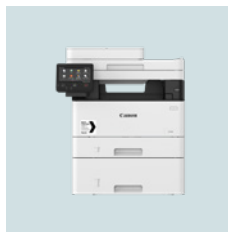
Serie i-SENSYS X 1238i 1238iF 38 ppm 1238i 38 ppm