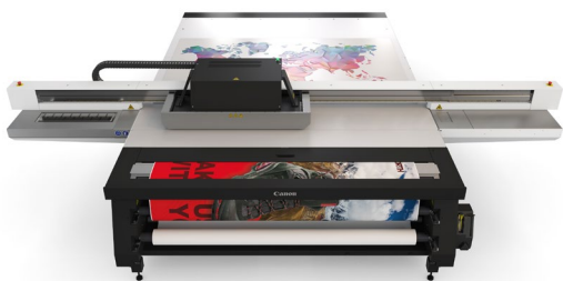
Arizona 2300 FLXflow mit PRISMAelevate XL-Software: Erstellt taktile Drucke für die Ausstellung World Unseen.