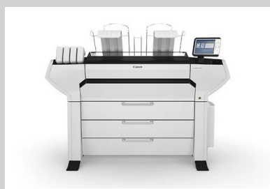
ColorWave 3000 Series