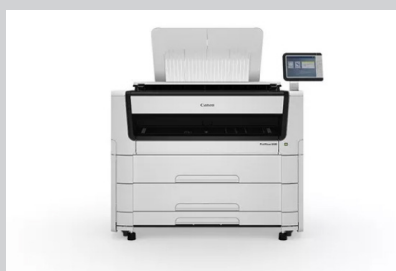
PlotWave 5000 Series