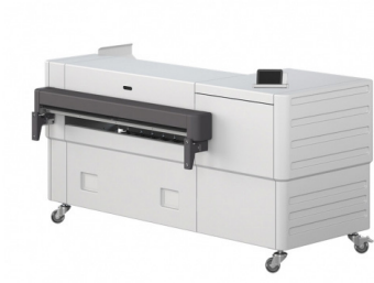
Seria Folder Express