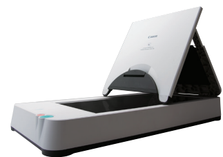
DIN A4-Flachbett-Scaneinheit 101