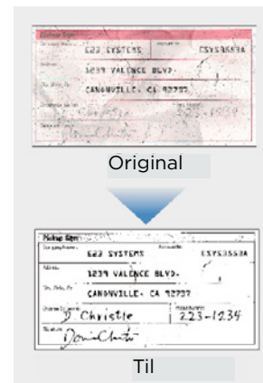
Brug af Active Threshold

Takket være de effektive billedbehandlingsfunktioner leverer DR-S130 konsekvent resultater i høj kvalitet. Funktioner som automatisk farveregistrering, genkendelse af tekstretning, automatisk registrering af papirstørrelse og justering af skævhed sparer værdifuld tid uden behov for at justere indstillingerne. Ved hjælp af Active Threshold-funktionen kan forskellige dokumenter scannes og behandles sammen, uanset om de indeholder utydelig tekst eller mønstrede baggrunde og uden behov for at ændre indstillinger, hvilket sparer værdifuld tid.