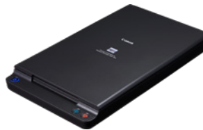
A4 Flatbed Scanner Unit 102

Scan gebonden boeken, tijdschriften en kwetsbaar materiaal met de Flatbed Scanner Unit 102 voor documenten tot A4- of de Flatbed Scanner Unit 201 voor het documenten tot A3-formaat. Via een USB-verbinding werken deze flatbedscanners naadloos samen met (uitsluitend) de DR-C225 II zodat u vanuit twee scanbronnen kunt scannen en op iedere scan dezelfde functies voor beeldverbetering kunt toepassen.