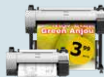
iPF TA-Serie - 24" (61,0 cm) - 91,4 cm (36")