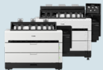
iPF TZ-30000 - 91,4 cm (36")