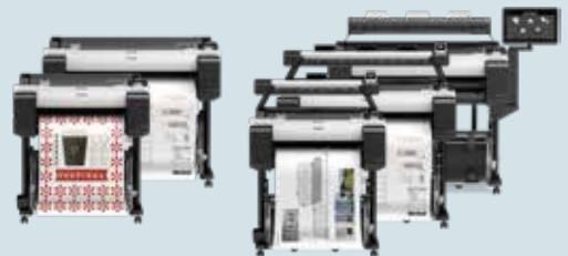
iPF TM-Serie - 24" (61,0 cm) - 36" (91,4 cm)