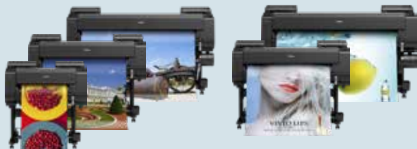
iPF PRO-/PRO-S-Serie - 24" (61,0 cm) - 60" (152,4 cm)