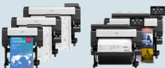
iPF TX-Serie - 24" (61,0 cm) - 44" (111,8 cm)