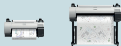
TA-Serie - 61,0 cm (24") - 91,4 cm (36")