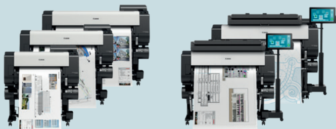
TX-Serie - 61,0 cm (24") - 111,8 cm (44")