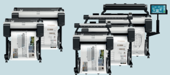
TM-Serie - 61,0 cm (24") - 91,4 cm (36")