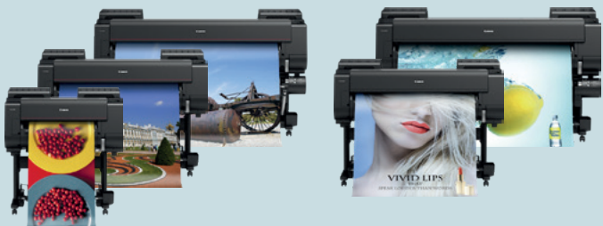
PRO-/PRO-S-Serie - 61,0 cm (24") - 152,4 cm (60")