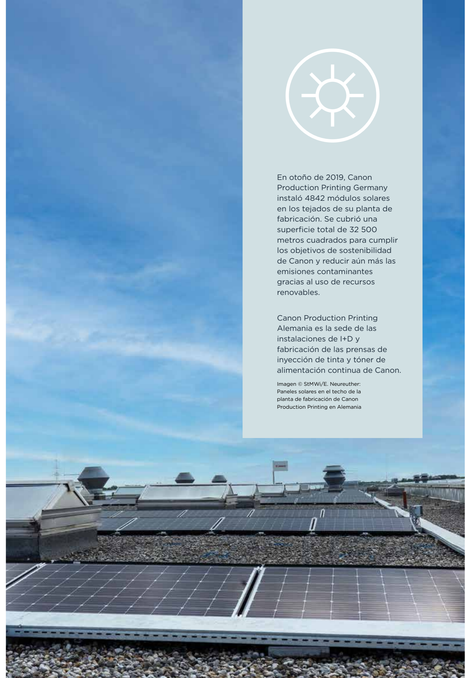
Paneles solares en el techo de la planta de fabricación de Canon Production Printing en Alemania

Canon Production Printing Alemania es la sede de las instalaciones de I+D y fabricación de las prensas de inyección de tinta y tóner de alimentación continua de Canon.