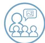
Imagen para el bien