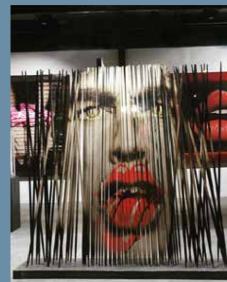
Mikado Art Mikado Sticks i tryckt aluminium, Elkeslasi Surface Design

Våra produktspecialister, applikationsexperter och kundansvariga finns här för din skull. De representerar en av de största tryckportföljerna i branschen från roll-to-roll och arkskrivare, UV-flatbäddskrivare och skärsystem till vattenbaserade bläckstråleskrivare och unika tekniska system med CrystalPoint and Single-pass. Vi kan lära dig det du behöver kunna för att tänja gränserna för tryck och material och skapa enastående erbjudanden för dina befintliga eller potentiella tryckkunder. ○