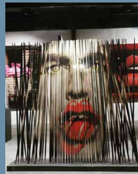
Mikado Art Печать на алюминиевых палочках Микадо, компания Elkeslasi Surface Design

Наши специалисты и менеджеры по работе с клиентами всегда готовы ознакомить вас с нашей продукцией и ее практическим применением и помочь с выбором. Вам будет представлен самый широкий спектр печатного оборудования на рынке – от рулонных и листовых печатных машин, планшетных УФ-принтеров и листорезального оборудования до струйных принтеров с чернилами на водной основе, уникальной технологии односторонней печати и системы CrystalPoint. Мы поможем вам приобрести необходимые навыки, чтобы раздвинуть привычные границы применения печати и материалов и создать уникальный пакет услуг для имеющих и потенциальных потребителей печатной продукции. ○