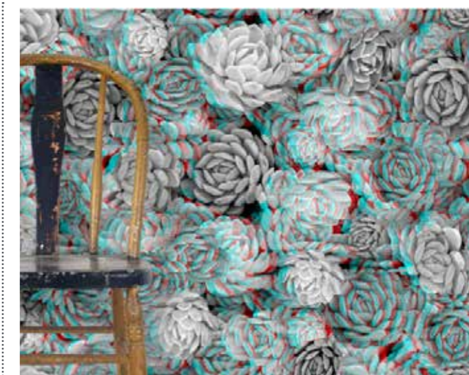
Twenty2, carta da parati 3D

Se, da un lato, appare evidente come il settore dell'interior design in Europa stia avendo effetti diretti sulla stampa, allo stesso modo anche l'innovazione nelle tecnologie di stampa avrà un impatto ugualmente importante sul design stesso. ○