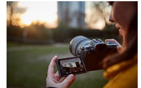
Entwicklungsprogramm für Studenten