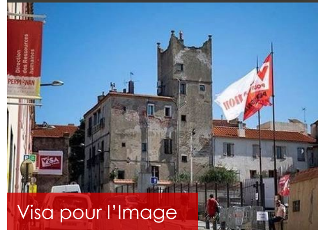
Visa pour l'Image