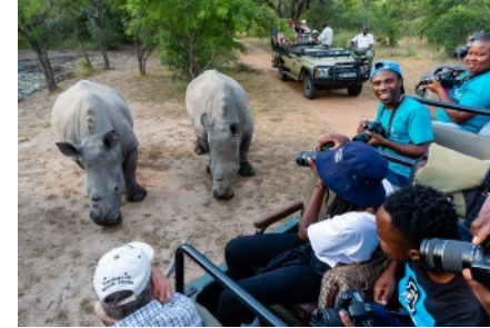
Young People Programm

Mit unseren Produkten, unserem Fachwissen und unseren Partnerschaften helfen wir Menschen mit unterschiedlichem Hintergrund in der gesamten EMEA-Region, sich auf die Zukunft vorzubereiten und sich zu entwickeln.