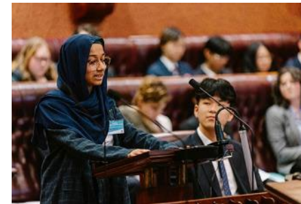
Canon Young Champion of the Year Award