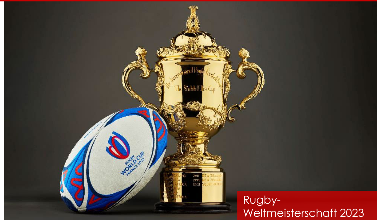
Rugby- Weltmeisterschaft 2023